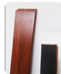
* PISO CON AISLANTE SOLO FORMATO (B)

LA PRIMERA IMAGEN MUESTRA UNA INSTALACIÓN CON PISO DE BAMBÚ SWWENGE LA SEGUNDA IMAGEN MUESTRA UN LOCAL COMERCIAL EN DONDE SE UTILIZÓ BAMBÚ SW CARBONIZADO