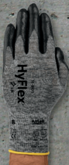
GUANTE HYFLEX NITRILO LISO SKU: AS23-410