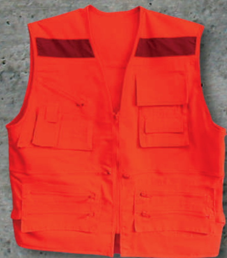
CHAQUETA GEÓLOGO POPLIN SKU: RT13-121