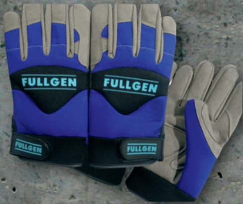
GUANTE ANTIVIBRACIÓN - FULLGEN SKU: AS25-123