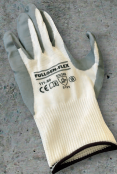
GUANTE FULLGEN FOAM SKU: AS23-41180