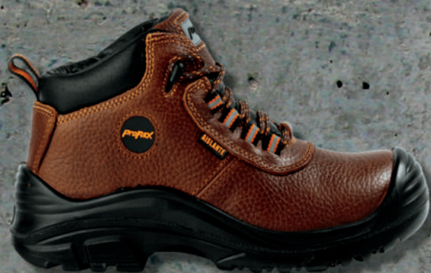
BOTÍN SEC.PROFLEX 106