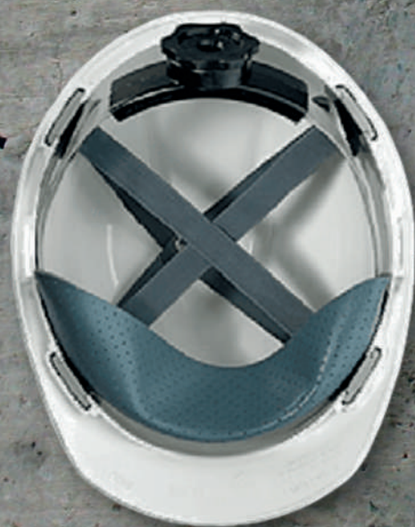
ARNÉS P.CASCOS MSA. V-GARD FAST TRAC 3