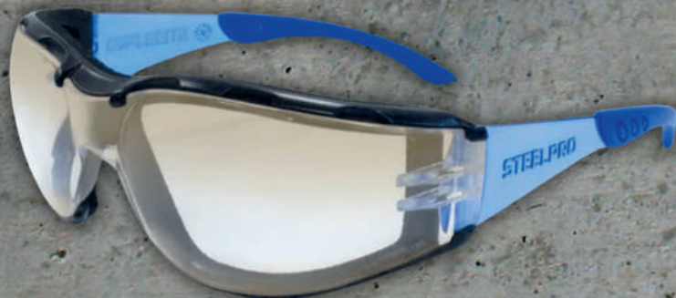
LENTE STEELPRO SPY FLEX PLUS IN OUT