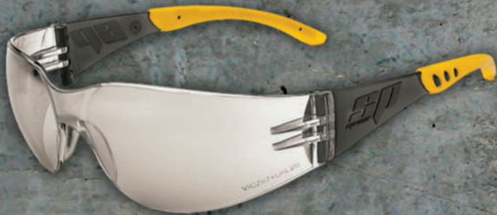
LENTE OX SOBRE LENTE