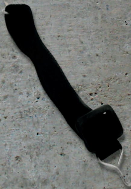
BARBIQUEJO CASCO /GANCHO METAL