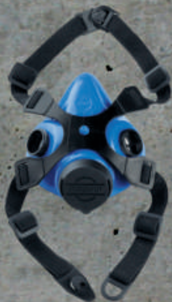
RESPIRADOR MASPROT 2 VIAS