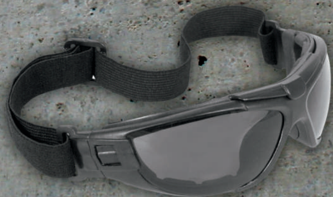
LENTE RADIANS OSCURO ANTI-FOG