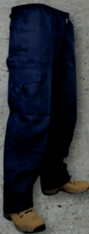
PANTALON POPLIN CARGO F/POLAR