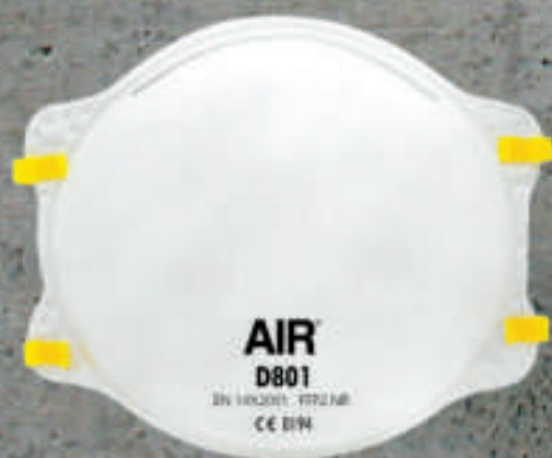
MASCARILLA AIR D801 PARA POLVO