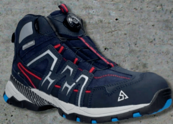
BOTÍN SHERPAS AZUL SH 417