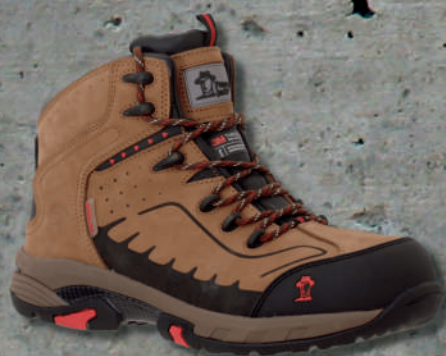
PANAMA JACK PJ515