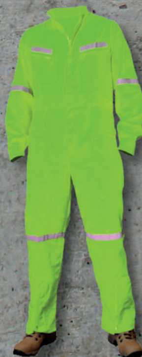
OVEROL POPLIN C/REFLEC. SKU: 1111190119