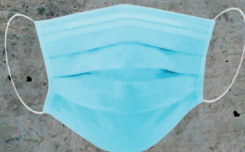
MASCARILLA DESECHABLE 3 PLIEGUES