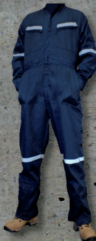
OVEROL GABARDINA C/REF. 2PULG AZUL SKU: 11104270102