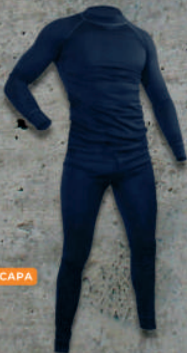
PIJAMA PRIMERA CAPA