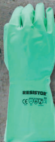
GUANTE NITRILO FLOCK DARRYS SKU: AS22-310