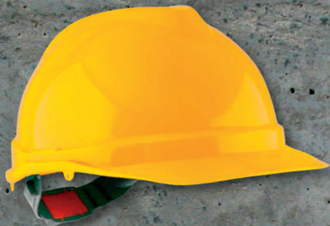
CASCO DE SEG. EVO TOP 33