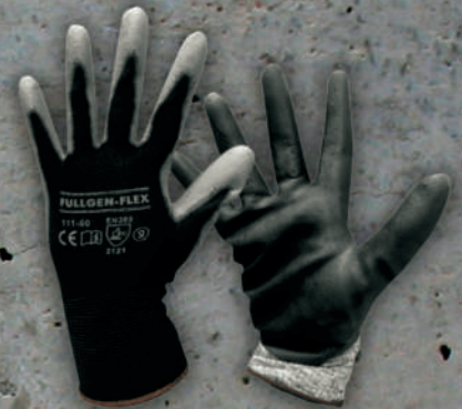
GUANTE FULLGEN POLIURETANO SKU: AS23-41160