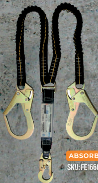
ABSORBEDOR CINTA ELASTICADA TIPO "Y"