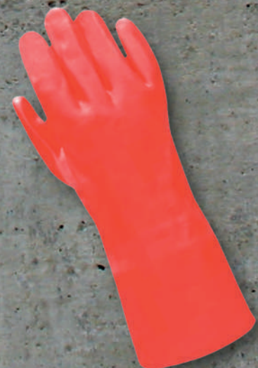
GUANTE P.V.C. ROJO SKU: AS22-301