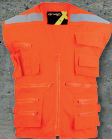
CHAQUETA GEÓLOGO GABARDINA SKU: 10504070112