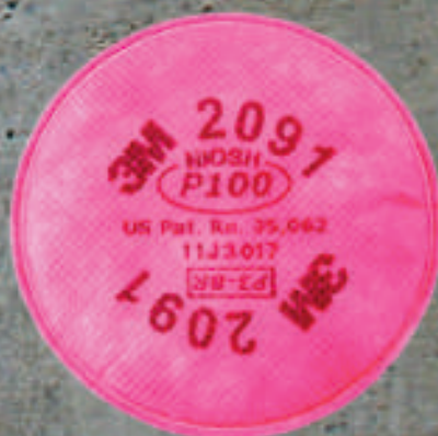
FILTRO PARA PARTICULAS P100