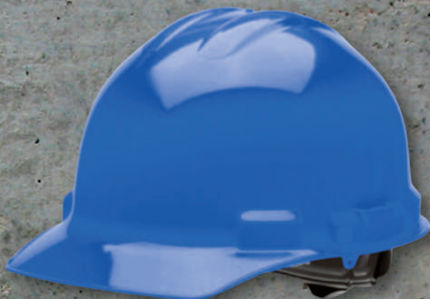
CASCO SEG.PROSEG PLUS